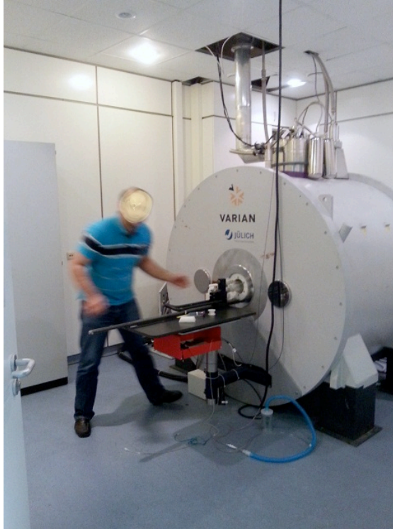
Abb. 1: Animal Scanner, MRT (Magnetresonanztomographie)